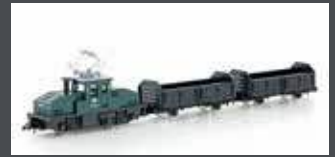
K105006 GÜTERZUG-SET BR 169 MIT 2 GÜTERWAGEN DB, EP.IV