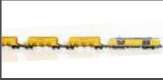
LC96003 BAUZUG DIESELLOK BR 247 + 3x SCHOTTERWAGEN DB BAHNBAU