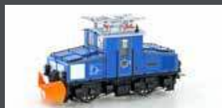
H43111 ZUGSPITZBAHN TAL- LOK NR.1 MIT SCHNEEPFLUG, EP.V, H0M / 12MM H43111S MIT SOUND