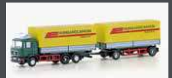
LC4637 MAN F90, 3-ACHS WECHSELPRITSCHEN-HÄNGERZUG HUNGAROCAMION