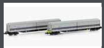
H23444 2ER SET KUPPELWAGEN HABFIS RAILADVENTURE, EP.VI