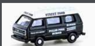
LC4349 VW T3 STREET FOOD