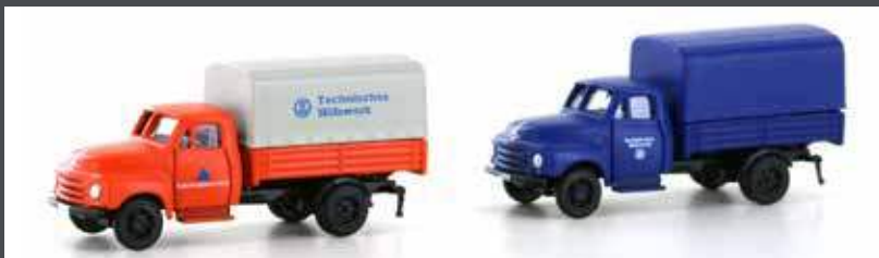
LC3235 2ER SET OPEL BLITZ P/P THW + KATASTROPHENSCHUTZ