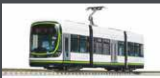
K148041 STRASSENBAHN HIRODEN 1000 LRV HER, EP.VI