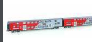
JC60120 2ER SET DOPPELSTOCKWAGEN ÖBB, EP.V, WIESEL