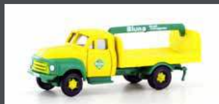
LC3237 OPEL BLITZ GETRÄNKEPRITSCH BLUNA