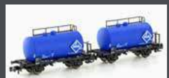
H24833 2ER SET LEICHTBAUKESSELWAGEN DB/ARAL, EP.IV