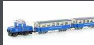
H43104 ZUGSPITZBAHN TAL- LOK MIT 2 PERSONENWAGEN, EP.V, H0 / 16.5MM H43104S MIT SOUND