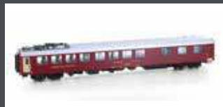
LS472005 UIC-X SPEISEWAGEN WRM SBB, EP.IVA, ROT