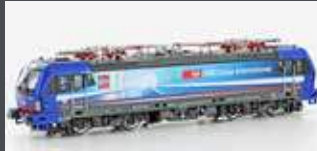
LS17612 E-LOK BR 193 518 VECTRON SBB CARGO / CENERI, EP.VI, AC