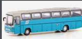
LC4424 MERCEDES BENZ 0303 RHD ÖBB BAHNBUS (AT)