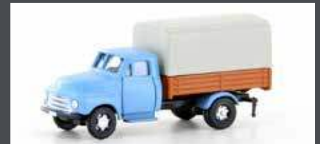
LC3232 OPEL BLITZ PRITSCH/PLANE MIT HOLZPRITSCH