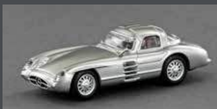
LE87300 MB 300 SLR UHLENHAUT COUPÉ, W 196 S, SILBER MIT ROTER INNENAUSSTATTUNG, 1:87