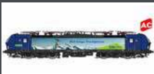
LS17616 E-LOK BR 193 VECTRON HUPAC / BLS CARGO, EP.VI, AC LS17616S AC SOUND