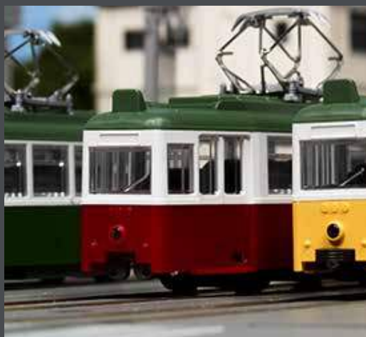
K14806-3 STRASSENBAHN DÜWAG, 2-TLG., ROT/WEISS