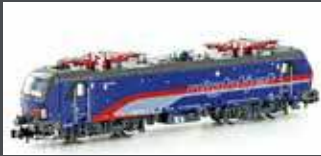
H30162 E-LOK RH 1293 200 VECTRON ÖBB NIGHTJET, EP.VI H30162S MIT SOUND