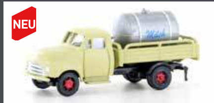
LC3240 OPEL BLITZ MILCH