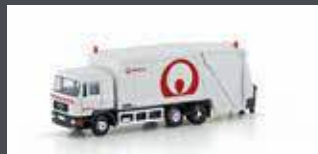
LC4662 MAN F90 MÜLLWAGEN VEOLIA