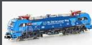
H30168 E-LOK BR 193 813 VECTRON RAILPOOL/DB NETZE, EP.VII H30168S MIT SOUND