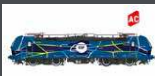
LS16651 E-LOK BR 192 SMARTRON EGP, EP.VI, AC LS16651S AC SOUND