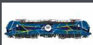
LS16151 E-LOK BR 192 SMARTRON EGP, EP.VI LS16151S DCC SOUND