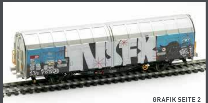
GRAFIK SEITE 2