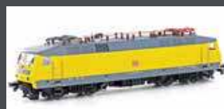
LS16086 BR120 DB EP.V DBAG LOGO GELB/GRAU