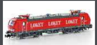
H30173 E-LOK BR 193 VECTRON SNÄLLTAGET, EP.VI H30173S MIT SOUND