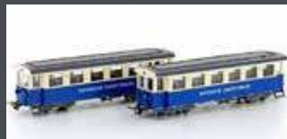
H43107 ZUGSPITZBAHN 2ER SET PERSONENWAGEN, EP.V, H0 / 16.5MM