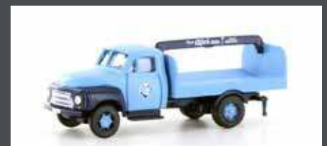
LC3238 OPEL BLITZ GETRÄNKEPRITSCH AFRI