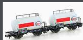
H24832 2ER SET LEICHTBAUKESSELWAGEN DB/ESSO, EP.IV