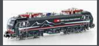
H30169 E-LOK BR 193 657 VECTRON SBB CARGO/SHADOWPIERCER, EP.VI H30169S MIT SOUND