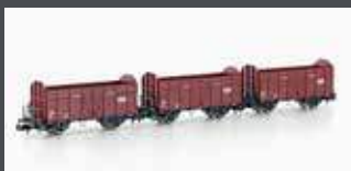
H24302 3ER SET OFFENE GÜTERWAGEN FBKK SBB, EP.IV, MIT SBB KREUZ