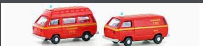
LC4342 VW T3 2ER SET FEUERWEHR