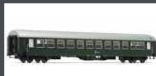
JC90001 UIC-X PERSONENWAGEN 2.KL. ÖBB, EP.III, GRÜN