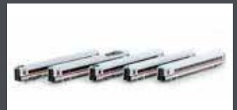
K10954 ERGÄNZUNG BR 412 / ICE4, 5-TLG. DB AG / KLIMASCHÜTZER, MOTORISIERT