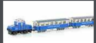
H43105 ZUGSPITZBAHN TAL- LOK MIT 2 PERSONENWAGEN, EP.V, H0M / 12MM