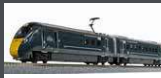
K101671 TRIEBZUG CLASS 800/0 GWR, 5-TLG., EP.VI