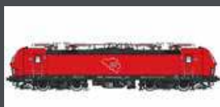
LS16076 E-LOK BR 193 341 DB CARGO BELGIEN, EP.VI