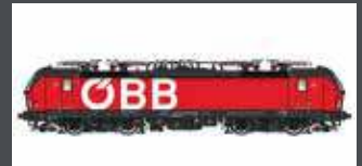
LS17911 E-LOK RH 1293 VECTRON ÖBB, EP.VI, AC LS17911S MIT SOUND