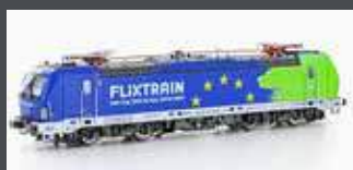
LS16078 E-LOK BR 193 826 FLIXTRAIN "EUROPA", EP.VI# LS16078S SOUND