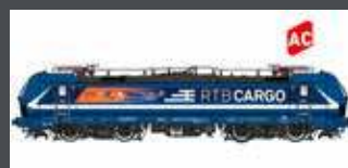
LS16653 E-LOK BR 192 SMARTRON NORTHRAIL / RTB CARGO, EP.VI, AC LS16653S AC SOUND