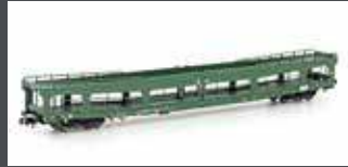
MF33308 AUTOTRANSPORT- WAGEN DDM 916 DBAG, EP.V, GRÜN, 2.NR.