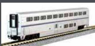
K1560980 PERSONENWAGEN SUPERLINER I COACH AMTRAK, EP.VI