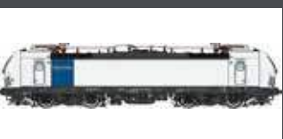
LS16079 E-LOK BR 193 813 RAILPOOL/ALPEN-SYLT-EXPRESS, EP.VI