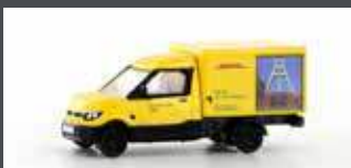
LC4553 STREETSCOOTER WORK "DHL RUHRGEBIET" 1:160