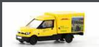
LC4554 STREETSCOOTER WORK "DHL STUTTGART" 1:160