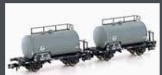
H24801 2ER SET LEICHTBAUKESSELWAGEN DB/EVA, EP.III