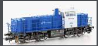
90551 DIESELLOK VOSSLÖH G1000 BB CFL CARGO, EP.VI, DC 90552 DC SOUND 90553 AC SOUND