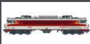
LS10320 E-LOK CC 6502 SNCF, EP.VI, ARZENS