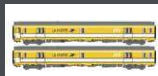
LS40446 2ER SET POSTWAGEN PA UIC SNCF LA POSTE PTT GELB EP. IV