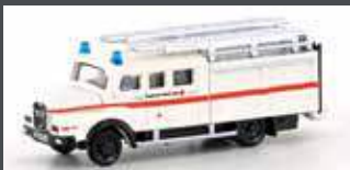
LC4223 MAN LF 16-TS GERÄTEWAGEN DRK