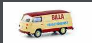
LC3945 VW T2 TRANSPORTER BILLA