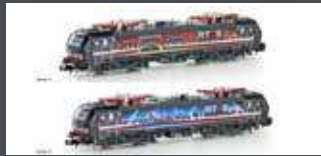
H30171 E-LOK BR 193 701 VECTRON SBB CARGO/RUHRPIERCER, EP.VII H30171S MIT SOUND