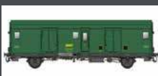
MW30318 2ER SET SNCF GEPÄCKWAGEN DD2AI, GRÜN-GRAU EP.IVA MIT S-BEL