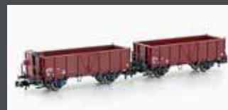
H24352 2ER SET OFFENE GÜTERWAGEN L6 SBB, EP.IV, STAHL-AUSFÜHRUNG