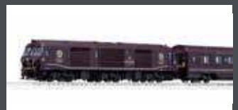
K101519 CRUISETRAIN 8-TLG. JR KRC, EP.VI, SEVEN STARS IN KYUSHU