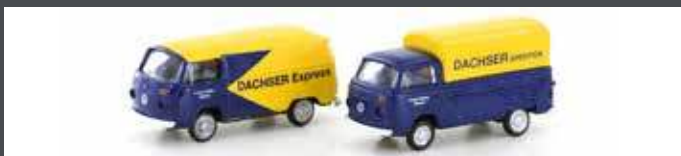
LC3921 VW T2 SET "DACHSER SPEDITION"