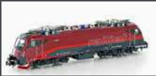
H2738 E-LOK RH 1216 TAURUS ÖBB RAILJET, EP.VI H2738S MIT SOUND