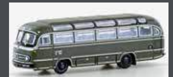
LC4438 MERCEDES BENZ 0321H US ARMY BERLIN, GRÜN