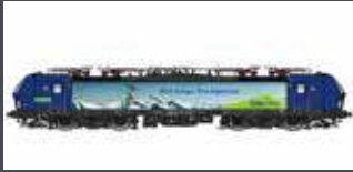
LS17116 E-LOK BR 193 VECTRON HUPAC / BLS CARGO, EP.VI LS17116S MIT SOUND