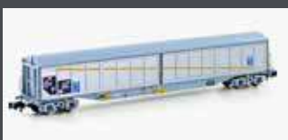
H23441 SCHIEBEWANDWAGEN HBILS SBB, EP.IV-V