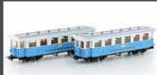
H43103 ZUGSPITZBAHN 2 WAGEN H0E / 9MM