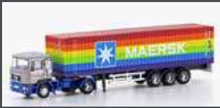
LC4066 MAN F90 CONTAINER-SATTELZUG MAERSK