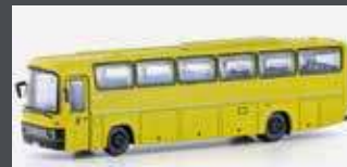
LC4429 MERCEDES BENZ 0303 RHD DEUTSCHE BUNDESPOST