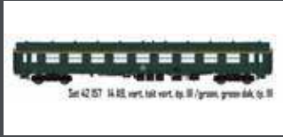
LS42157 SNCB 14 A9 GRÜN EP. III