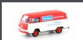
LC3917 VW T2 TRANSPORTER "BOFROST"