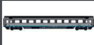
LS47359 EC PERSONENWAGEN, 2.KL. BPM SBB, EP.VI, EX-CISALPINO