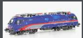
JC29350 DC E-LOK RH 1216 012 TAURUS ÖBB NIGHTJET EP.VI JC29352 DC SOUND