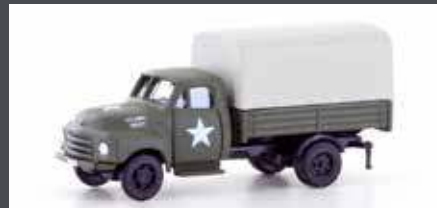
LC3231 OPEL BLITZ PRITSCH/PLANE US. ARMY