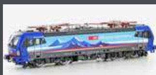
LS17111 E-LOK BR 193 SBB CARGO ALPIERCER 2, EP.VI