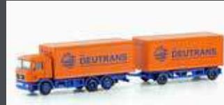
LC4605 MAN F90, 3-ACHS KOFFER-HÄNGERZUG DEUTRANS