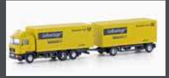
LC4603 MAN F90, 3-ACHS KOFFER-HÄNGERZUG DEUTSCHE POST