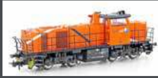
90248 DIESELLOK VOSSLÖH G1000 BB NORTHRAIL, EP.VI