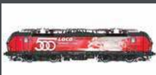
LS17912 E-LOK RH 1293 018 VECTRON ÖBB, EP.VI, 500TH, AC LS17912S MIT SOUND