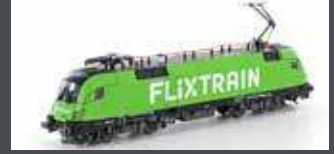
JC18182 E-LOK BR182.505 TAURUS FLIXTRAIN, EP.VI, AC SOUND