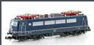
H2884 E-LOK BR 184 111-3 DB, EP.IV, STAHLBLAU