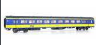
LS44250 PERSONENWAGEN ICR-1 2.KL. B NS, EP.IV, INTERNATIONAL