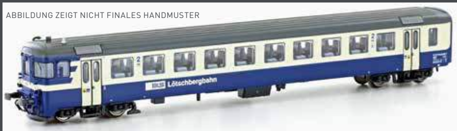
ABBILDUNG ZEIGT NICHT FINALES HANDMUSTER

746-755 eingesetzt. Seltener konnte man sie in Pendelzügen mit Ae4/4 und Re4/4 sehen. Die ersten 6 Steuerwagen waren bei der Ablieferung grün, erhielten aber nach 1970 das zum BLS-Personenwagenpark passende crème/blauwe Kleid. Ab Mitte der 90er-Jahre gab es diverse Änderungen in der Bemalung und dem Einsatz, so waren 2005 vier umgebaute Steuerwagen mit den neuen Nummern BDT 946-949 mit Autozügen im Einsatz und die Bt 951-953 verkehrten modernisiert mit Aussenschwenktüren in den RX Pendelzügen.