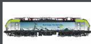
LS17115S MIT SOUND