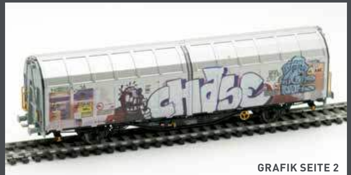
GRAFIK SEITE 2