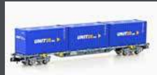
MF33444 CONTAINERWAGEN SGNS HUPAC / SBB, EP.VI