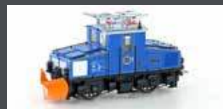
H43112 ZUGSPITZBAHN TAL- LOK NR.1 MIT SCHNEEPFLUG, EP.V, H0E / 9MM H43112S MIT SOUND