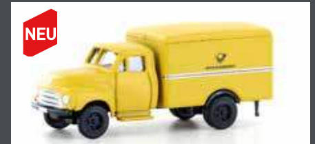
LC3241 OPEL BLITZ POST