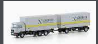
LC4633 MAN F90, 3-ACHS WECHSELPRITSCHEN-HÄNGERZUG SCHENKER CARGO