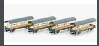
LC96010 4ER AUTOVERLADEZUG ZWISCHENWAGEN, BLS, EP.V