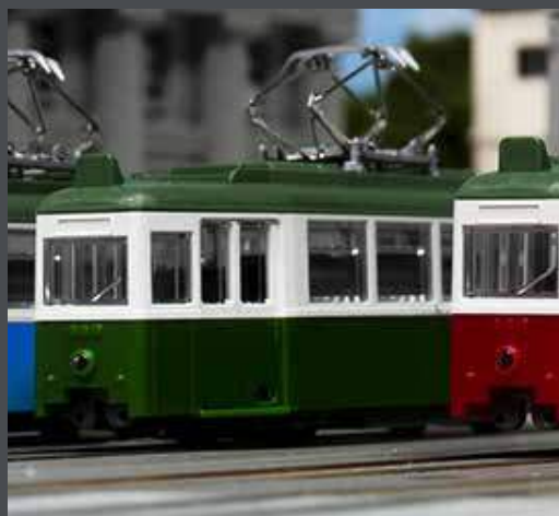
K14806-2 STRASSENBAHN DÜWAG, 2-TLG., GRÜN/WEISS