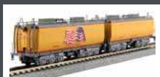
K106085 2ER SET ZUSATZTENDER UP / EXCURSION TRAIN, EP.V-VI