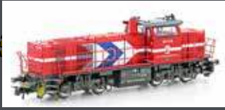
90244 DIESELLOK VOSSLÖH G1000 BB HGK, EP.V-VI