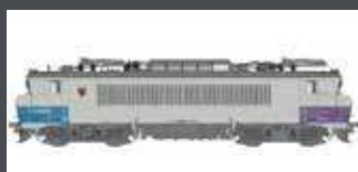
LS11557 E-LOK BB 22400R SNCF, EP.VI, ENVOYAGE, AC LS11557S MIT SOUND