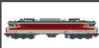
LS10830 CC 6534 SNCF GRAU/ROT/ORANGE VENISSEUX EP. V-VI AC