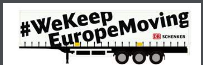
LC4075 AUFLIEGER DB SCHENKER