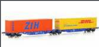
90663 CONTAINERWAGEN SGGMRSS'90 CBR, EP.VI, DHL/ ZIH