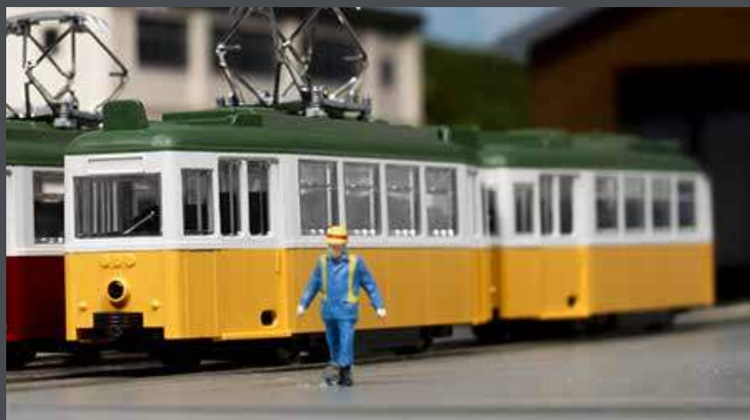
K14806-4 STRASSENBAHN DÜWAG, 2-TLG., GELB/WEISS