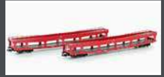
MF33303 2ER SET AUTO- TRANSPORTWAGEN DDM 916 EETC, EP.VI, ROT