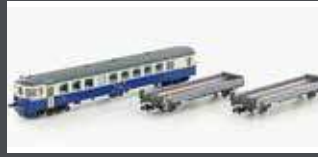
LC96009 3ER AUTOVERLADEZUG, STEUERWG. BDT+2X AUFFAHRWG., BLS, EP.V