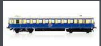
JC13020 TRIEBWAGEN RH 5044.21 ÖBB, EP.IV, CREME/ BLAU, AC