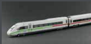
K10952 BR 412 / ICE4, 4-TLG. DB AG / KLIMASCHÜTZER, GRUNDSETMOTORISIERT K10952S MIT SOUND