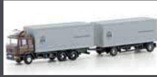
LC4602 MAN F90, 3-ACHS KOFFER-HÄNGERZUG UPS