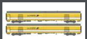
LS40447 2ER SET POSTWAGEN PE UIC SNCF LA POSTE, GELB EP. V