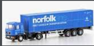
LC4067 MAN F90 CONTAINER-SATTELZUG NORFOLKLINE