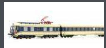
JC74310 TRIEBZUG RH 4010.17, 6-TLG. ÖBB, EP.III, FLÜGELRAD