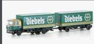
LC4606 MAN F90, 3-ACHS KOFFER-HÄNGERZUG DIEBELS