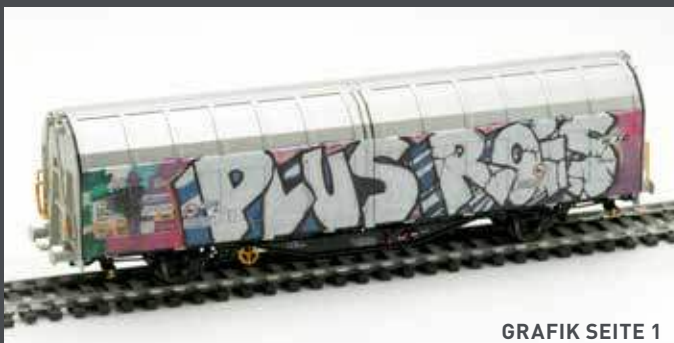
GRAFIK SEITE 1

AM245040 SCHIEBEWANDWAGEN HBBILLNS SBB, EP.VI, GRAFITTI EDITION