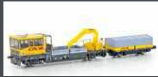
H23565 GLEISKRAFTWAGEN ROBEL SERIE 700 CFL, EP.V-VI, MOTORISIERT