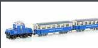
H43106 ZUGSPITZBAHN TAL- LOK MIT 2 PERSONENWAGEN, EP.V, H0E / 9MM H43106S MIT SOUND