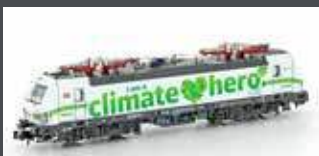
H3013 E-LOK BR 193 363 VECTRON DB "CLIMATE HERO", EP.VI H3013S MIT SOUND