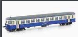
H23943 PENDELZUG-STEUERWAGEN BT BLS, EP.IV, CREME/BLAU, INNENBEL.