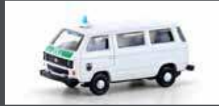
LC4352 VW T3 BUS ZOLL