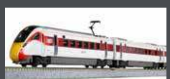
K101674 TRIEBZUG CLASS 800/2 LNER / AZUMA, 5-TLG., EP.VI