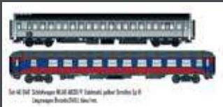
LS46048 2TLG. SET WLAB AB30/P INOX -GE. STREIFEN TRI/BVCMBZ BLAU/ROT