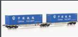
90702 CONTAINERWAGEN SGGMRSS'90 AAE, EP.VI, CHINA RAIL