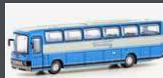
LC4425 MERCEDES BENZ 0303 RHD DEUTSCHE TOURING