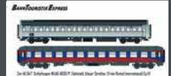
LS46047 2TLG. SET WLAB AB30/P INOX-BL. STREIFEN TRI/BVCMBZ BLAU/ROT