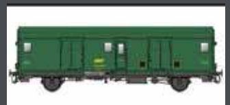
MW30317 SNCF GEPÄCKWAGEN DD2AI, GRÜN-GRAU EP. IVA MIT ZUGSCHLUSSBEL.