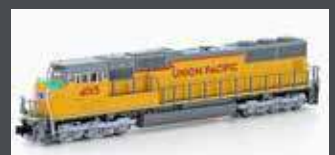
K1764015 DIESELLOK EMD SD70M UP, EP.VI, EXCURSION, #4015