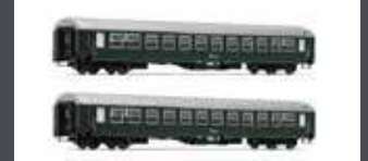
JC60140 2ER SET UIC-X PERSONENWAGEN 2.KL. ÖBB, EP. IV, GRÜN