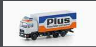
LC4601 MAN F90, 3-ACHS KOFFER PLUS