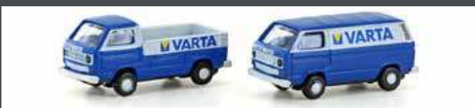
LC4345 VW T3 2ER SET VARTA