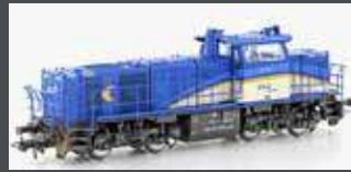
90548 DIESELLOK VOSSLÖH G1000 BB EVB LOGISTIK, EP.VI, DC 90549 DC SOUND