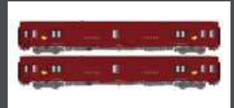
LS40443 2ER SET POSTWAGEN PA UIC SNCF EP.IV, BORDEAUX