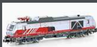
H3122 ZWEIKRAFTLOK BR 248 VECTRON DM MKB, EP.VI H3122S MIT SOUND