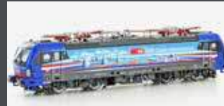
LS17613 E-LOK BR 193 525 SBB CARGO / HOLLANDPIERCER, EP.VI, AC