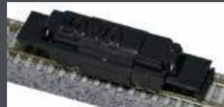
K11108 MOTORISIERTES CHASSIS 2-ACHS TRAM 2020 SPUR N