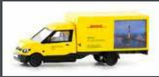
LC4561 STREETSCOOTER WORK-L "DHL DÜSSELDORF" 1:160