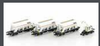
LC66306 3ER SET SCHÜTTGUTWAGEN + LIEBHERR A922 RAIL SERSA, EP.VI