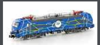
H3006S E-LOK BR 192 SMARTRON EGP, EP.VI, MIT SOUND