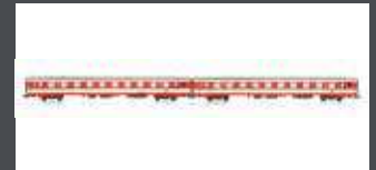
JC60270 2-TLG. SEIT REISEZUGWAGEN SPARLACK-LACKIERUNG