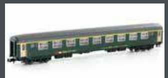
K23120 SBB RIC WAGEN NEUES LOGO 1. KL. AM