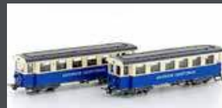
H43108 ZUGSPITZBAHN 2ER SET PERSONENWAGEN, EP.V, H0M / 12MM