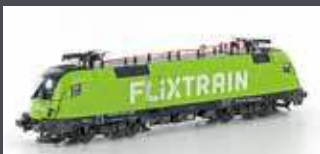
JC28180 E-LOK BR182.505 TAURUS FLIXTRAIN, EP.VI