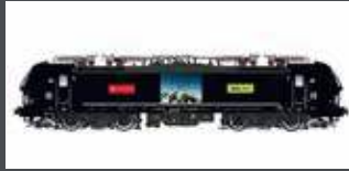
LS17117 E-LOK BR 193 VECTRON MRCE/BLS/CROSSRAIL, EP.VI LS17117S MIT SOUND