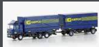
LC4635 MAN F90, 3-ACHS WECHSELPRITSCHEN-HÄNGERZUG GEFCO