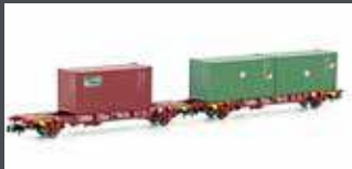
MF33373 2ER SET CONTAINERWAGEN LGS SNCB, EP.V