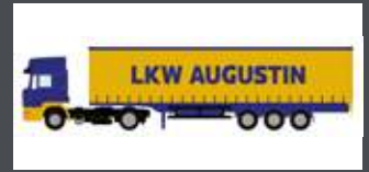
LC4069 MAN F90 GARDINEN-PLANEN-SATTELZUG LKW AUGUSTIN (AT)