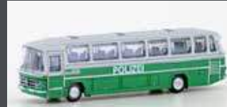
LC4414 MERCEDES BENZ 0302 RÜH POLIZEI