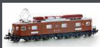
H10184 E-LOK AE 6/8 BLS 8-ACHSIG 207 BRAUN, EP.III