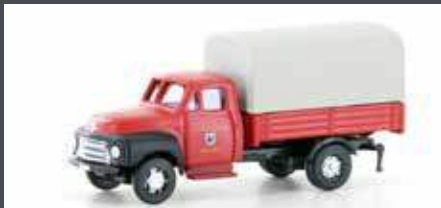
LC3230 OPEL BLITZ PRITSCH/PLANE FREIWILLIGE FEUERWEHR