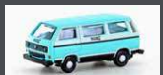
LC4348 VW T3 BUS DEUTSCHE TOURING