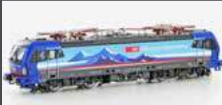
LS17611 E-LOK BR 193 SBB CARGO ALPPIERCER 2, EP.VI, AC