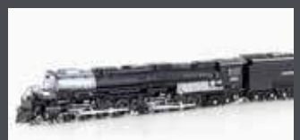
K1264014 DAMPFLOK CLASS 4000 BIGBOY UNION PACIFIC, EP.VI, #4014, MUSEUMSAUSFÜHRUNG