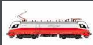
JC18100 E-LOK RH 1116 181 ÖBB CITYJET, EP.VI, AC JC18102 AC SOUND