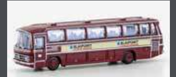
LC4415 MERCEDES BENZ 0302 RÜH DB BAHNBUS