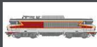
LS10992 E-LOK BB 15020 SNCF, EP.IV, ARZENS, AC