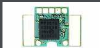
K29353 FR 11 DIGITALDECODER F. INNENBELEUCHTUNG, 1 STÜCK/WAGEN