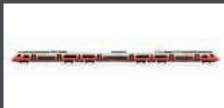
JC17600 TRIEBZUG RH 4746 DESIRO ÖBB CITYJET, EP.VI, AC