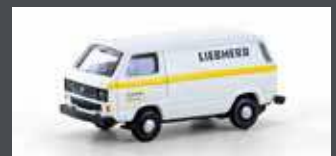
LC4341 VW T3 LIEBHERR SERVICE