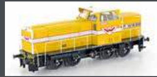
HE10021571 DIESELLOK MAK 650D WIEBE EP.IV DC ANALOG