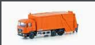
LC4660 MAN F90 MÜLLWAGEN NEUTRAL, ORANGE