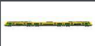
JC18602 TRIEBZUG RH 4744 DESIRO GYSEV VENTUS, EP.VI, AC SOUND