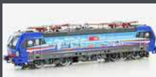
LS17113 E-LOK BR 193 525 SBB CARGO / HOLLANDPIERCER, EP.VI LS17113S MIT SOUND