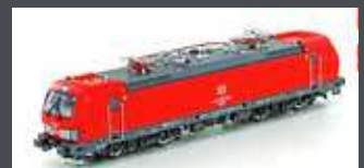
LS18503S VECTRON BR193, DB SCHENKER RAIL POLSKA, ROT, EP.VI AC SOUND