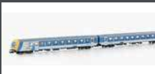
JC60360 3-TLG. SET WENDEZUG-SET 2X 2.KLASSEWAGEN MAV-LACKIERUNG