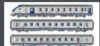
LS41234DC 3ER SET PERSONENWAGEN VU+VTU SNCF, EP.VI, TER PACA