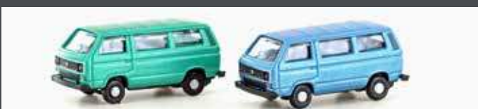
LC4347 VW T3 2ER SET (METALLIC SERIE)