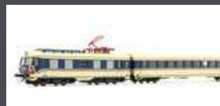
JC74310 TRIEBZUG RH 4010.17, 6-TLG. ÖBB, EP.III, FLÜGELRAD