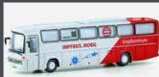
LC4427 MERCEDES BENZ 0303 RHD IMPFBUS