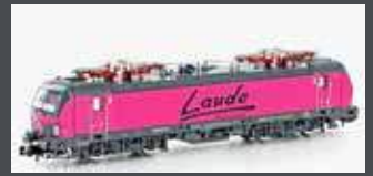
H30157 E-LOK BR 193 VECTRON LAUDE, EP.VI H30157S MIT SOUND