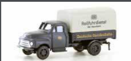
LC3233 OPEL BLITZ PRITSCH/PLANE DB ROLLFUHRDIENST