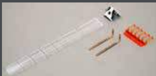
K11213 INNENBELEUCHTUNG 'N' LED GELB / WARMWEISS