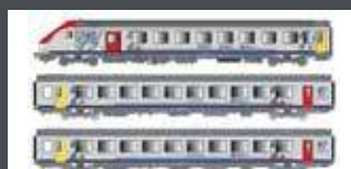
LS41233DC 3ER SET PERSONENWAGEN VU+VTU SNCF, EP.VI, TER BOURGOGNE