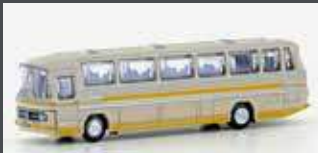
LC4416 MERCEDES BENZ 0302 RÜH CREME/ORANGE