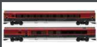
JC70218 2ER SET PERSONENWAGEN ÖBB RAILJET, EP.VI, ECO/BAR