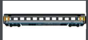
LS47361 EC PERSONENWAGEN, 1.KL. APM SBB, EP.VI, EX-CISALPINO