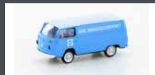
LC3922 VW T2 DOKA "ARAL TANKSTELLENDIENST"