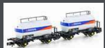
H24853 2ER SET LEICHTBAUKESSELWAGEN DSB/STATOIL, EP.IV