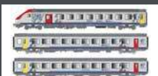
LS41233AC 3ER SET PERSONENWAGEN VU+VTU SNCF, EP.VI, TER BOURGOGNE, AC