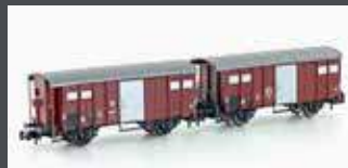
H24250 2ER SET GEDECKTE GÜTERWAGEN K3 SBB, EP.III