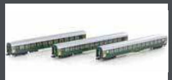
K23011 3ER SET RIC PERSONENWAGEN BM, 2.KL. SBB, EP.IV