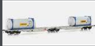
90660 CONTAINERWAGEN SGGMRSS'90 HUPAC, EP.VI, BERTSCHI