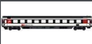
LS47371 SBB BPM EC WEISS/SCHWARZ/ROT FAHRRADABTEIL EP.VI