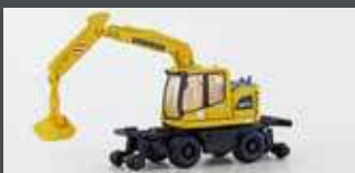
LC4265 LIEBHERR A922 RAIL 2-WEGE BAGGER MIT GREIFER