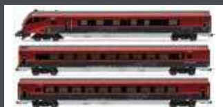
JC70310 3ER SET PERSONENWAGEN ÖBB RAILJET, EP.VI, M.STEUERWG.