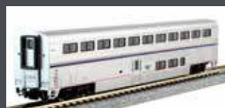
K1560981 PERSONENWAGEN SUPERLINER I COACH AMTRAK, EP.VI, 2.NR.