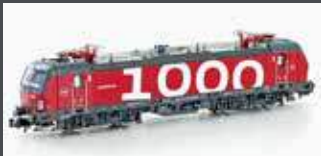
H30170 E-LOK SERIE EB 3200 DSB, EP.VI, 1000TH VECTRON H30170S MIT SOUND