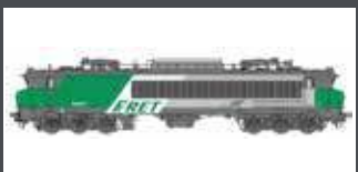
LS10317 E-LOK CC 6571 SNCF FRET, EP.VI