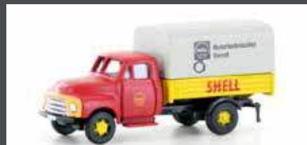
LC3234 OPEL BLITZ PRITSCH/PLANE SHELL