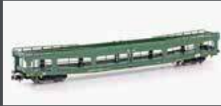
MF33307 AUTOTRANSPORT- WAGEN DDM 916 DBAG, EP.V, GRÜN, 1.NR.