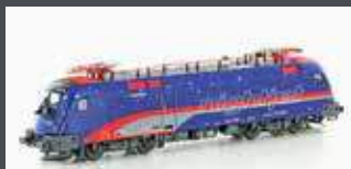
JC28200 E-LOK RH 1116 195 TAURUS ÖBB NIGHTJET, EP.VI JC28202 SOUND