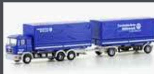
LC4636 MAN F90, 3-ACHS WECHSELPRITSCHEN-HÄNGERZUG THW