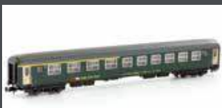
K23121 SBB RIC WAGEN NEUES LOGO 1/2. KL. ABM