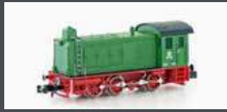
H30254 DIESELLOK V36 VTG, EP.IV