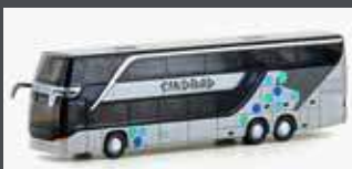
LC4486 SETRA S 431 DT SINDBAD (PL), METALLIC