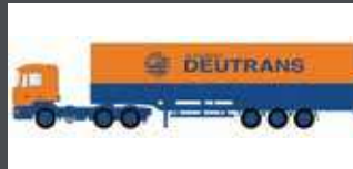
LC4072 MAN F90 PLANEN-SATTELZUG DEUTRANS