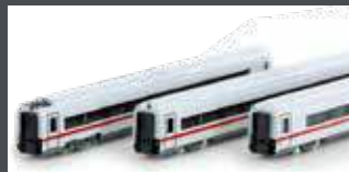
K10953 ERGÄNZUNG BR 412 / ICE4, 3-TLG. DB AG / KLIMASCHÜTZER