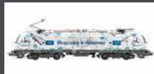
JC29152 E-LOK RH 1216 TAU- RUS WLC, EP.VI, SOUND