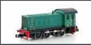
H30253 DIESELLOK HLD 231 SNCB, EP.III