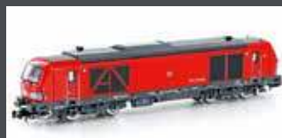
H3111 DIESELLOK BR 247 902 DB CARGO, EP.VI