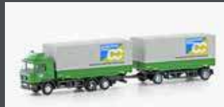
LC4632 MAN F90, 3-ACHS WECHSELPRITSCHEN-HÄNGERZUG CRETSCHMAR CARGO