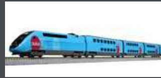
K101763 TRIEBZUG TGV DUPLEX, 10-TLG. SNCF/OUIGO, EP.VI