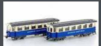
H43109 ZUGSPITZBAHN 2ER SET PERSONENWAGEN, EP.V, H0E / 9MM