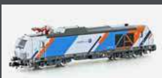
H3124 ZWEIKRAFTLOK BR 248 VECTRON DM NORTHRAIL, EP.VI H3124S MIT SOUND