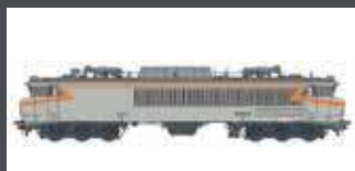
LS10333.1 E-LOK CC 6558 SNCF, EP.IV-V LS10333.1S MIT SOUND