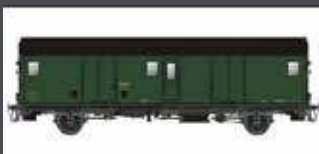
MW30310 SNCF GEPÄCKWAGEN DQD2M, GRÜN-SCHWARZ EP. IIIB MIT SCHLUSSBEL