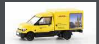
LC4552 STREETSCOOTER WORK "DHL KÖLN" 1:160