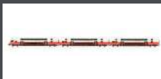
JC76800 3ER SET DOPPELSTOCKWAGEN ÖBB CITYJET, EP.VI