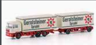
LC4604 MAN F90, 3-ACHS KOFFER-HÄNGERZUG GEROLSTEINER