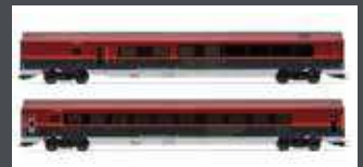
JC70217 2ER SET PERSONEN- WAGEN ÖBB RAILJET, EP.VI, ECO