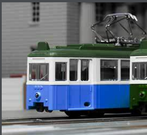
K14806-1 STRASSENBAHN DÜWAG, 2-TLG., BLAU/WEISS

wagen und verfügt über den neuen verbesserten Antrieb mit exzellenten Fahreigenschaften. Das Modell kann ab einem Radius von 90 mm betrieben werden.