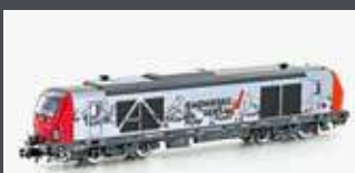
H3114 DIESELLOK BR 247 VECTRON DE SERSA, EP.VI H3114S MIT SOUND