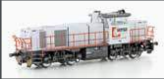
90554 DIESELLOK VOSSLÖH AM 845 SERSA, EP.VI, DC 90555 DC SOUND