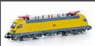
H2789 E-LOK BR 182 TAURUS DB NETZ, EP.VI H2789S MIT SOUND