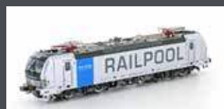
LS16066 VECTRON BR193 RAILPOOL EP.VI SILBER GROSSES LOGO