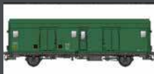
MW30314 SNCF GEPÄCKWAGEN DD2AI, GRÜN-GRAU EP. IIIC/D MIT SCHLUSSBEL.