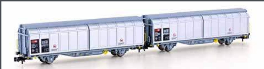
H24651 2ER SET SCHIEBEWANDWAGEN HBBILLNS DB CARGO, EP.V