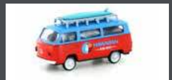
LC3923 VW T2 BUS "SURFING"