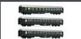
JC61304 3ER SET UIC-X PERSONENWAGEN ÖBB, EP.VI, GRÜN