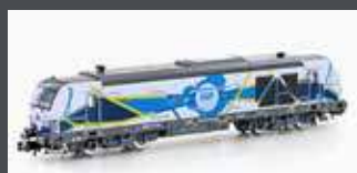
H3115 DIESELLOK BR 247 EGP, EP.VI H3115S MIT SOUND