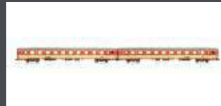
JC60260 2-TLG. SET REISEZUGWAGEN JAFFA-LACKIERUNG