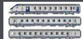
LS41234AC 3ER SET PERSONENWAGEN VU+VTU SNCF, EP. VI, TER PACA, AC