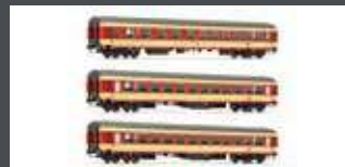
JC61300 3ER SET UIC-X PERSONENWAGEN ÖBB, EP.IV, SPARLACK