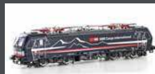
LS17618S E-LOK BR 193 657 SBB CARGO/SHADOWPIERCER, EP.VI, AC SOUND