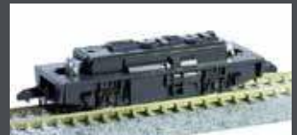
K11109 MOTORISIERTES CHASSIS 2-ACHS VERSION 2020 SPUR N