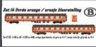
LS42165 2TLG. 14 B9 EXA9+ B10 EXA4B6 ORANG. IV SNCB