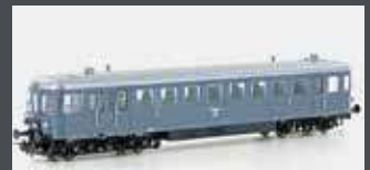
JC23030 TRIEBWAGEN VT 923 DRG, EP.II, GRAU