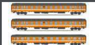
JC90401 3ER SET UIC-X VOR-SERIE-PERSONENWAGEN ÖBB, EP.IV, ORANGE