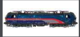
LS17413 E-LOK RH 1293 200 VECTRON ÖBB NIGHTJET, EP.VI