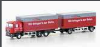
LC4608 MAN F90, 3-ACHS KOFFER-HÄNGERZUG RAIL CARGO AUSTRIA