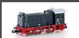
H28250 DIESELLOK V36 DB, EP.III