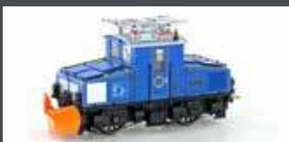
H43110 ZUGSPITZBAHN TAL- LOK NR. 1 M. SCHNEEPFLUG EP.V, H0 / 16.5MM H43110S MIT SOUND