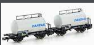
H24834 2ER SET LEICHTBAUKESSELWAGEN DB/DANZAS, EP.IV