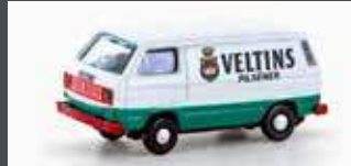
LC4358 VW T3 VELTINS