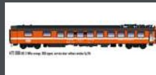
LS472006 UIC-X SPEISEWAGEN WRM SBB, EP.IVA, ORANGE