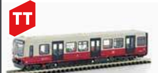
LC90483 SOUVENIR BERLINER S-BAHN BR 481 DESIGN 2020 1:120 EXKL. LEMKE