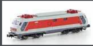
PI1210 E-LOK E444.005 FS, EP.VI, FONDAZIONE