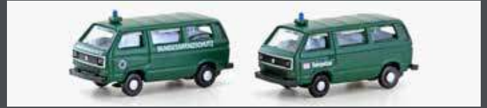
LC4353 VW T3 2ER SET BGS / BAHNPOLIZEI