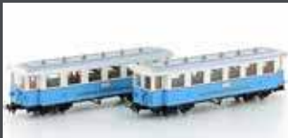
H43101 ZUGSPITZBAHN 2 WAGEN H0M / 12MM