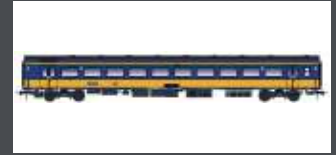
LS44241 PERSONENWAGEN ICRMH 2.KL. BPMZ NS, EP.VI, BENELUX