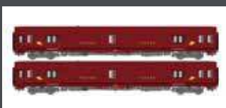
LS40444 2ER SET POSTWAGEN PA UIC SNCF EP.IV, BORDEAUX