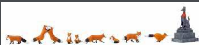
K06601 FIGUREN SET FÜCHSE, 1/87, 9 STK.