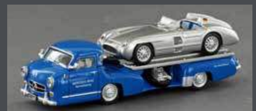
LE87310 MERCEDES BENZ RENNTRANSPORTER, „DAS BLAUE WUNDER“ BELADEN MIT EINEM MERCEDES BENZ 300 SLR ROADSTER, 1:87