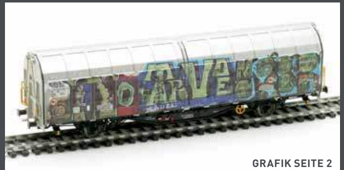
GRAFIK SEITE 2