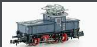
H3050 E-LOK E63 DRG, EP.II, GRAU/BLAU