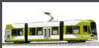
K148045 STRASSENBAHN HIRODEN 1001 LRV HER/HIRODEN BUS, EP.VI