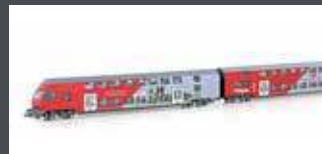
JC60430 3ER SET DOPPELSTOCKWAGEN ÖBB, EP.VI, TAUERNBAHN