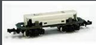
K11105 MOTORISIERTES CHASSIS 4-ACHS SPUR N