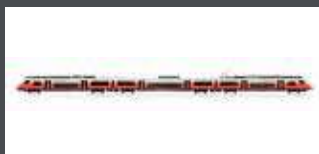
JC47602 TRIEBZUG RH 4746 DESIRO ÖBB CITYJET, EP.VI, SOUND