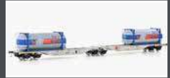
90662 CONTAINERWAGEN SGGMRSS'90 ÖBB, EP.VI, TROLL