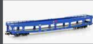
MF33311 AUTOTRANSPORT- WAGEN DDM 916 SNCB, EP.IV