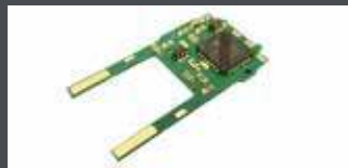
K29351 EM 13 DIGITALDECODER F. MOTORWAGEN