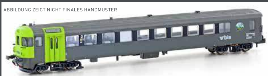
ABBILDUNG ZEIGT NICHT FINALES HANDMUSTER

H23944 STEUERWAGEN BT BLS, EP.V, VERSION MIT AUSSENSCHWINGTÜREN