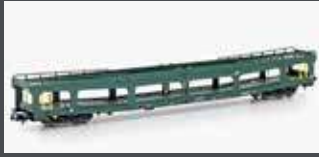
MF33298 AUTOTRANSPORT- WAGEN DDM 916 SNCF, EP.V