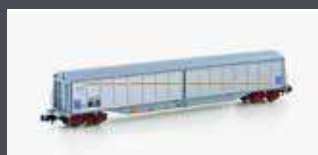
H23443 SCHIEBEWANDWAGEN HABIS SNCF/EVS, EP.IV-V