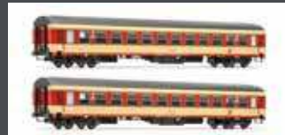
JC60160 2ER SET UIC-X PERSONENWAGEN 2.KL. ÖBB, EP. III, SPARLACK