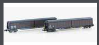
H23440 2ER SET SCHIEBEWANDWAGEN HABILS SBB, EP.V-VI, GEALERT