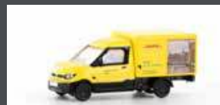
LC4555 STREETSCOOTER WORK "DHL HAMBURG" 1:160