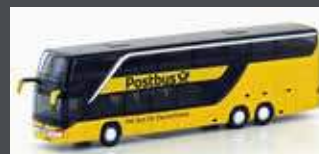
LC4482 SETRA S 431DT POSTBUS