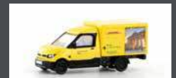
LC4556 STREETSCOOTER WORK "DHL BERLIN" 1:160