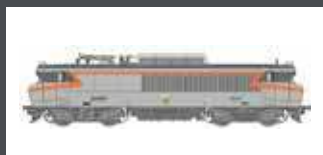
LS10481 E-LOK BB 15040 SNCF, EP.V, BETON LS10481S MIT SOUND