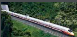
K101616 TRIEBZUG SERIE N700T SHINKANSEN, 12-TLG. THSRC, EP.VI