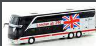
LC4462 SETRA S 431 DT DB IC BUS / LONDON