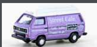
LC4346 VW T3 STREET CAFÉ (METALLIC SERIE)