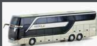
LC4487 SETRA S 431 DT POSTBUS (AT), METALLIC GOLD