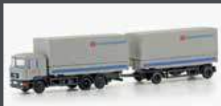
LC4634 MAN F90, 3-ACHS WECHSELPRITSCHEN-HÄNGERZUG DB GÜTERVERKEHR WINNER