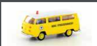
LC3924 VW T2 BUS "ADAC"