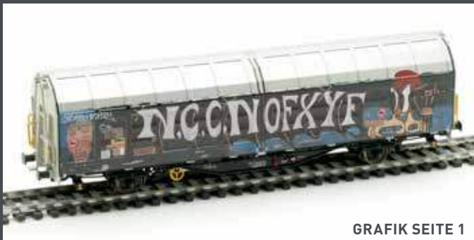
GRAFIK SEITE 1

AM245039 SCHIEBEWANDWAGEN HBBILLNS SBB, EP.VI, GRAFITTI EDITION