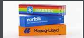
H9013 3ER SET 40' CONTAINER