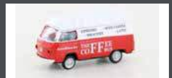
LC3950 VW T2 FOODTRUCK "COFFEE"