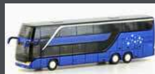
LC4488 SETRA S 431DT REISEBUS NEUTRAL, METALLIC BLAU