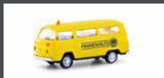
LC3925 VW T2 BUS ÖAMTC PANNENHILFE