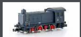
H28252 DIESELLOK WR360 C14 WH, EP.II