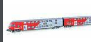
JC60130 3ER SET DOPPELSTOCKWAGEN ÖBB, EP.V, WIESEL