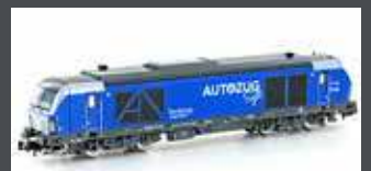
H3112 DIESELLOK BR 247 908 AUTOZUG SYLT, EP.VI H3112S MIT SOUND