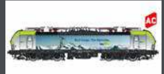
LS17615 E-LOK RE 475 VECTRON BLS CARGO, EP.VI, AC LS17615S AC SOUND