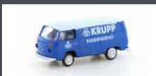
LC3897 VW T2 TRANSPORTER KRUPP KUNDENDIENST