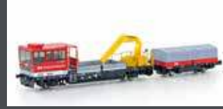
H23568 GLEISKRAFTWAGEN ROBEL TM234 SOB, EP.V-VI, MOTORISIERT