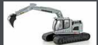
LC4264 LIEBHERR COMPACT BAGGER KETTE SILBER M. TIEFLÖFFEL