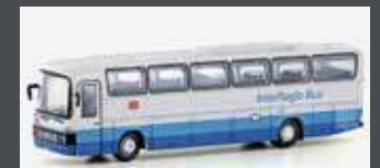
LC4426 MERCEDES BENZ 0303 RHD DB INTERREGIO BUS