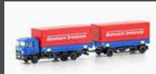
LC4630 MAN F90, 3-ACHS WECHSELPRITSCHEN-HÄNGERZUG WINNER