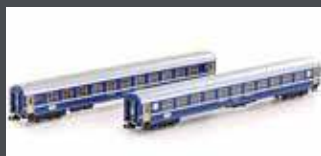
K23009 2ER SET RIC LIEGEWAGEN BCM SBB, EP.IV