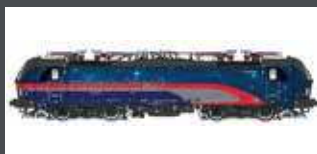
LS17913S E-LOK RH 1293 200 VECTRON ÖBB NIGHTJET, EP.VI, AC SOUND