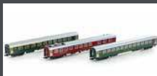
K23013 3ER SET RIC PERSONENWAGEN ABM+BM+WRTM SBB, EP. IV-V