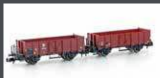
H24351 2ER SET OFFENE GÜTERWAGEN L6 SBB, EP.III, HOLZ-AUSFÜHRUNG