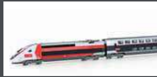
K101762 TRIEBZUG TGV DUPLEX, 10-TLG. SNCF/LYRIA, EP.VI