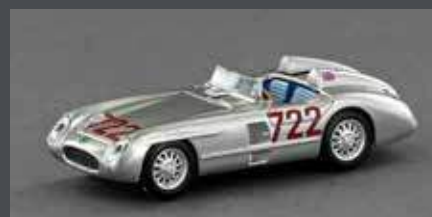
LE87302 MB 300 SLR ROADSTER #722, 2 KOPFSTÜTZEN. FAHRER: STIRLING MOSS UND DENIS JENKINSON, SIEGER MILLE MIGLIA 1956, 1:87