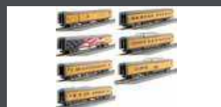
K106086 7ER SET PERSONENWAGEN UP / EXCURSION TRAIN, EP.V-VI