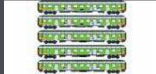
LS46034 5ER SET PERSONENWAGEN BVCMZ+BVCMBZ ALPEN-SYLT-EXPRESS, EP.VI LS46034AC AC