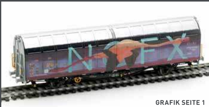
GRAFIK SEITE 1

Die Auflage dieser limitierten Wagen beträgt nur 200 St.