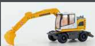
LC4266 LIEBHERR COMPACT BAGGER MIT TIEFLÖFFEL