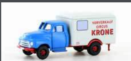
LC3236 OPEL BLITZ KOFFER CIRCUS KRONE