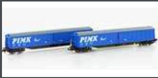
H23445 2ER SET SCHIEBEWANDWAGEN HABIS PIMK RAIL, EP.VI