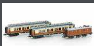
H22102 3-TLG. CIWL SET 1 SIMPLON-EXPRESS EP.I