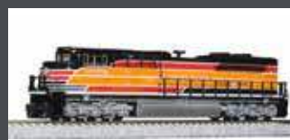
K1768406 DIESELLOK EMD SD70ACE UP/SP HERITAGE EP.6