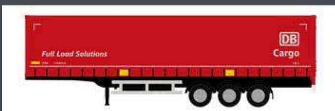
LC4074 AUFLIEGER DB CARGO