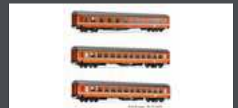
JC61302 3ER SET UIC-X PERSONENWAGEN ÖBB, EP.IV, ORANGE