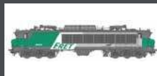
LS10332 E-LOK CC 6553 FRET SNCF EP. V-VI