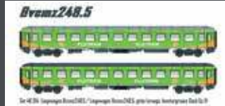
LS46014 2ER SET LIEGEWAGEN BVCMZ 248.5 FLIXTRAIN, EP.VI, HH-KÖLN