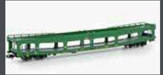
MF33312 AUTOTRANSPORT- WAGEN DDM 916 SNCB, EP.IV