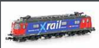
K10176 E-LOK RE 620 SBB CARGO /XRAIL, EP.V-VI, MIT KLIMAAANLAGE