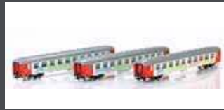
HE13060803 LIEGEWAGEN SET 3TLG. 2.KLASSE "BERLIN NIGHT EXPRESS" DC