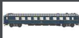
PI9907 SPEISEWAGEN WR BREDA CIWL / FS, EP.IV