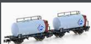
H24802 2ER SET LEICHTBAUKESSELWAGEN DB/ARAL, EP.III