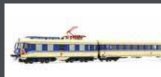
JC74110 TRIEBZUG RH 4010.14, 6-TLG. ÖBB, EP.IV, PFLATSCH