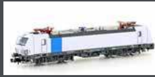
H30156 E-LOK BR 193 813 VECTRON RAILPOOL, EP.VI H30156S MIT SOUND