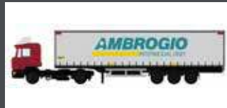
LC4071 MAN F90 GARDINEN-PLANEN-SATTELZUG AMBROGIO