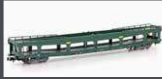
MF33299 AUTOTRANSPORT- WAGEN DDM 916 SNCF, EP.IV