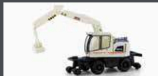
LC4253 LIEBHERR A922 RAIL 2-WEGE BAGGER SERSA MIT GREIFER