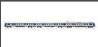
JC40940 TRIEBZUG RH 4020, 3-TLG ÖBB, EP.V