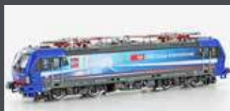
LS17112 E-LOK BR 193 518 SBB CARGO / CENERI, EP.VI LS17112S MIT SOUND