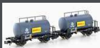
H24831 2ER SET LEICHTBAUKESSELWAGEN DB/VTG/SHELL, EP.IV