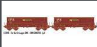
LS31116 2ER SET ERZWAGEN DMH SNCF / SIMOTRA, EP.V