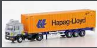
LC4068 MAN F90 CONTAINER-SATTELZUG HAPAG-LLOYD