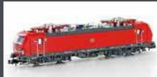
H30172 E-LOK BR 193 VECTRON DB CARGO, EP.VI H30172S MIT SOUND