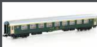
K23119 SBB RIC WAGEN ALTES LOGO 1. KL. AM