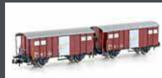
H24251 2ER SET GEDECKTE GÜTERWAGEN K3 SBB, EP.IV