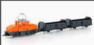
K105007 GÜTERZUG-SET E-LOK MIT 2 GÜTERWAGEN