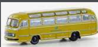
LC4439 MERCEDES BENZ 0321H DEUTSCHE BUNDESPOST