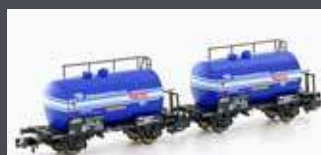
H24851 2ER SET LEICHTBAUKESSELWAGEN PKP/PETRO-CHEMIA, EP.IV/V