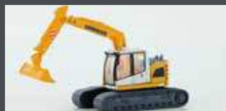
LC4267 LIEBHERR COMPACT KETTENBAGGER MIT BÖSCHUNGSSCHAUFEL