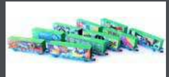
MF71012 10ER SET CONTAIN- ERWAGEN RENFE, EP.VI, NOAH'S TRAIN