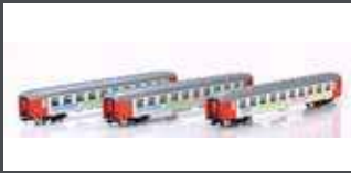
HE13060801 LIEGEWAGEN SET 3TLG. 2.KLASSE "BERLIN NIGHT EXPRESS" DC