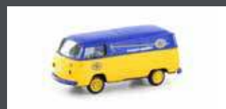
LC3918 VW T2 TRANSPORTER ASG