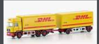
LC4607 MAN F90, 3-ACHS KOFFER-HÄNGERZUG DHL