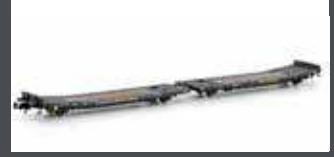
H23781 DOPPELFLACHWAGEN TWA 800A LAADKS TRANSWAGGON DR, EP.IV