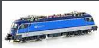
H2739 E-LOK RH 1216 TAURUS CD, EP.VI H2739S MIT SOUND