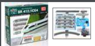
K10960 ICE4, 4-TLG. DBAG/ KLIMASCHÜTZER, STARTSET GLEIS-OVAL, TRAF0