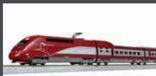
K101658 TRIEBZUG TGV T HALYS PBKA, 10-TLG., EP.VI, NEUES DESIGN