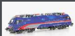
JC19350 E-LOK RH 1216 012 TAURUS ÖBB NIGHTJET EP.VI, AC JC19352 AC SOUND