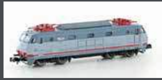
PI1208 E-LOK E444.100 FS, EP.V-VI, ESCI II