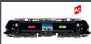
LS17617 E-LOK BR 193 VECTRON MRCE/BLS/CROSSRAIL, EP.VI, AC LS17617S AC SOUND