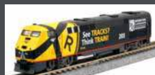
K1766039 DIESELLOK GE P42 AMTRAK, EP.VI, #203, LIFESAVER