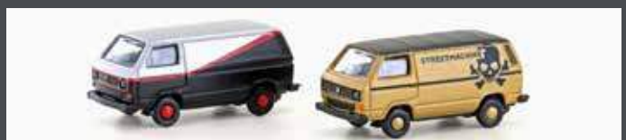
LC4344 VW T3 2ER SET TUNING (METALLIC SERIE)