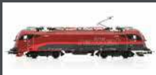
JC19102 E-LOK RH 1216 TAU- RUS ÖBB RAILJET, EP.VI, AC SOUND