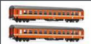
JC60150 2ER SET UIC-X PERSONENWAGEN 2.KL. ÖBB, EP. III, ORANGE