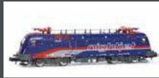
H2783 E-LOK BR1116 TAURUS ÖBB NIGHTJET EP.VI H2783S MIT SOUND