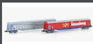
H23442 2ER SET SCHIEBEWANDWAGEN HABIS SNCF/KRONENBOURG, EP.IV