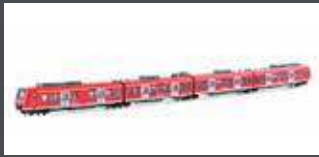
K101716 TRIEBZUG ET 425, 4-TLG. DB REGIO, EP.V-VI, NEUTRAL