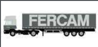
LC4070 MAN F90 GARDINEN-PLANEN-SATTELZUG FERCAM (IT)