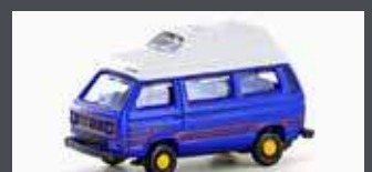
LC4350 VW T3 WESTFALIA CAMPER (METALLIC SERIE)