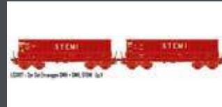
LS31117 2ER SET ERZWAGEN DMH SNCF / STEMI, EP.V