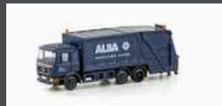
LC4661 MAN F90 MÜLLWAGEN ALBA