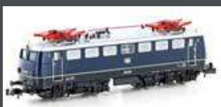
H28111 E-LOK E10.1 DB, EP.III, BLAU / SCHWARZ