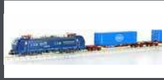
LC96004 GÜTERZUG E-LOK BR 192 + 2x CONTAINERWAGEN EVB LC96004S MIT SOUND