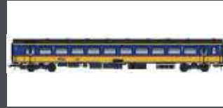
LS44239 PERSONENWAGEN ICRMH 2.KL. BPMZ NS, EP.VI, BENELUX