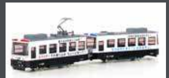
K14503-3 KATO POCKET LINE STRASSENBAHN 2TLG. P ATROL TRAM