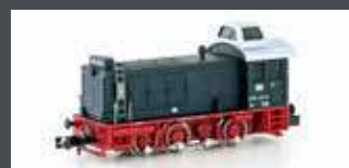
H28251 DIESELLOK BR 236 DB, EP.IV, MIT DACHKANZEL