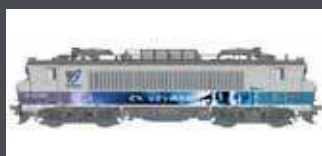
LS11203 E-LOK BB 7248R SNCF, EP.VI, TER ENVOYAGE LS11203S MIT SOUND