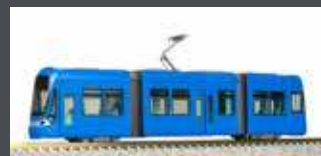
K14805-1 MODERNER STRASSENBAHN-GELENKTRIEBWAGEN, EP.V-VI, BLAU