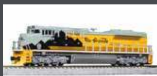
K1768405 DIESELLOK EMD SD70ACE UP/D&RGW HERITAGE EP.6