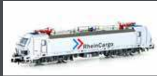
H30165 E-LOK BR 192 SMARTTRON RHC, EP.VI H30165S MIT SOUND