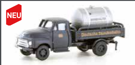
LC3239 OPEL BLITZ DB BIERBEHÄLTER