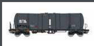
PI96210009 KESSELWAGEN ZACNS ATIR RAIL, EP.VI, 3.NR., IGRA