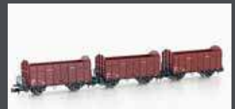
H24301 3ER SET OFFENE GÜTERWAGEN FBKK SBB, EP.IV