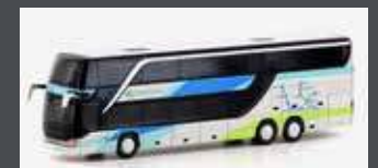
LC4485 SETRA S 431 DT WESTBUS (AT)