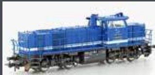
90560 DIESELLOK VOSSLÖH G1000 BB SPITZKE, EP.VI, DC 90561 DC SOUND 90562 AC SOUND