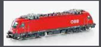
H2734 E-LOK RH 1216 TAURUS ÖBB, EP.VI H2734S MIT SOUND