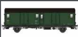
MW30312 SNCF GEPÄCKWAGEN DQD2M, GRÜN-SCHWARZ EP.IIIC/D MIT SCHLUSSBE