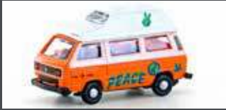
LC4351 VW T3 WESTFALIA CAMPER "GRAFFITI"