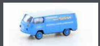
LC3920 VW T2 TRANSPORTER "MATZNER FEINKOST"