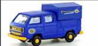
LC4357 VW T3 DOKA ASG