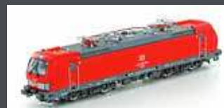
LS18003 E-LOK BR193 DB SCHENKER RAIL POLSKA, ROT, DB LOGO, EP.VI