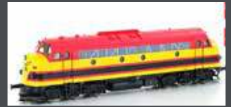
HE10044564 NOHAB MY 1151 EIVEL "KANSAS CITY" EP.VI GELB/ROT, AC SOUND