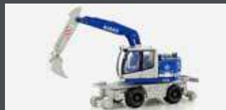
LC4259 LIEBHERR A922 RAIL 2-WEGE BAGGER KIBAG (CH) M. TIEFLÖFFEL