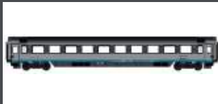
LS47358 EC PERSONENWAGEN, 2.KL. BPM SBB, EP.VI, EX-CISALPINO