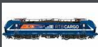
LS16153 E-LOK BR 193 SBB CARGO ALPIERCER 2, EP.VI LS16153S DCC SOUND