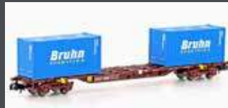
MF33442 CONTAINERWAGEN SGMNSS DB CARGO, EP.VI