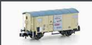
H24203 GEDECKTER GÜTERWAGEN K2 SBB/NESTLE, EP.II