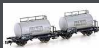
H24852 2ER SET LEICHTBAUKESSELWAGEN SNCF/MILLET, EP.III