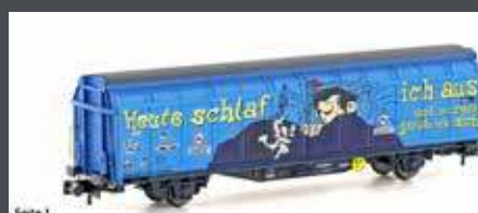
H24661 SCHIEBEWANDWAGEN HBBILLNS SBB/MIGROS, EP.VI