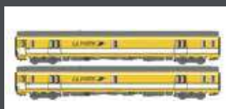
LS40445 2ER SET POSTWAGEN PA UIC SNCF LA POSTE GELB EP. IV