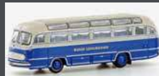
LC4435 MERCEDES BENZ 0321H WIENER LOKALBAHNEN