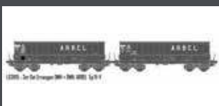
LS31115 2ER SET ERZWAGEN DMH SNCF / ARBEL, EP.IV-V