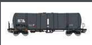
PI96210008 KESSELWAGEN ZACNS ATIR RAIL, EP.VI, 2.NR., IGRA