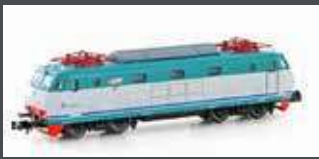
PI1205 E-LOK E444.056 FS, EP.V-VI, XMPR II