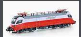
H2786 E-LOK RH 1116 181 ÖBB/CITYJET, EP.VI H2786S MIT SOUND