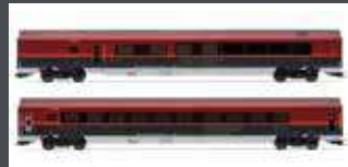
JC10217 2ER SET PERSONEN- WAGEN ÖBB RAILJET, EP.VI, ECO, AC