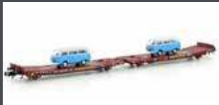
H23782 FLACHWAGEN TWA 800A LAADKS MIT 2X VW T2 TRANSWAGGON, EP.VI