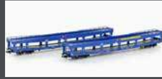
MF33301 2ER SET AUTO- TRANSPORTWAGEN DDM 916 EETC, EP.VI, BLAU