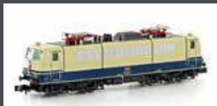
H2885 E-LOK BR 184 003-2 DB MUSEUMLOK, EP.V, BLAU/BEIGE