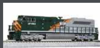
K1768410 DIESELLOK EMD SD70ACE UP/WP HERITAGE EP.6