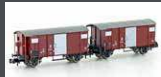
H24201 2ER SET GEDECKTE GÜTERWAGEN K2 SBB, EP.III