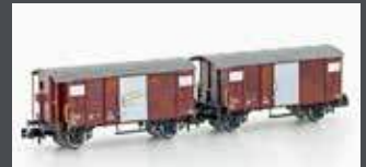
H24202 2ER SET GEDECKTE GÜTERWAGEN K2 SBB, EP.IV