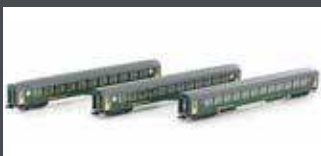
K23012 3ER SET RIC PERSONENWAGEN BM, 2.KL. SBB, EP. IV-V