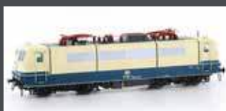
LS16021 E-LOK BR 184 DB, EP. IVC, BW SAARBRÜCKEN LS16021S MIT SOUND