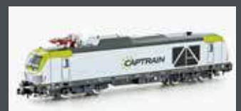
H3123 ZWEIKRAFTLOK BR 248 VECTRON DM CAPTRAIN, EP.VI H3123S MIT SOUND