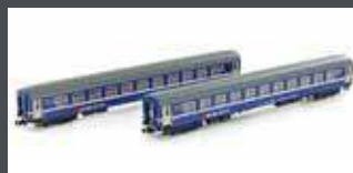
K23010 2ER SET RIC LIEGEWAGEN BCM SBB, EP.IV-V