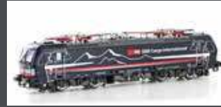
LS17118S E-LOK BR 193 657 SBB CARGO/SHADOWPIERCER, EP.VI, SOUND